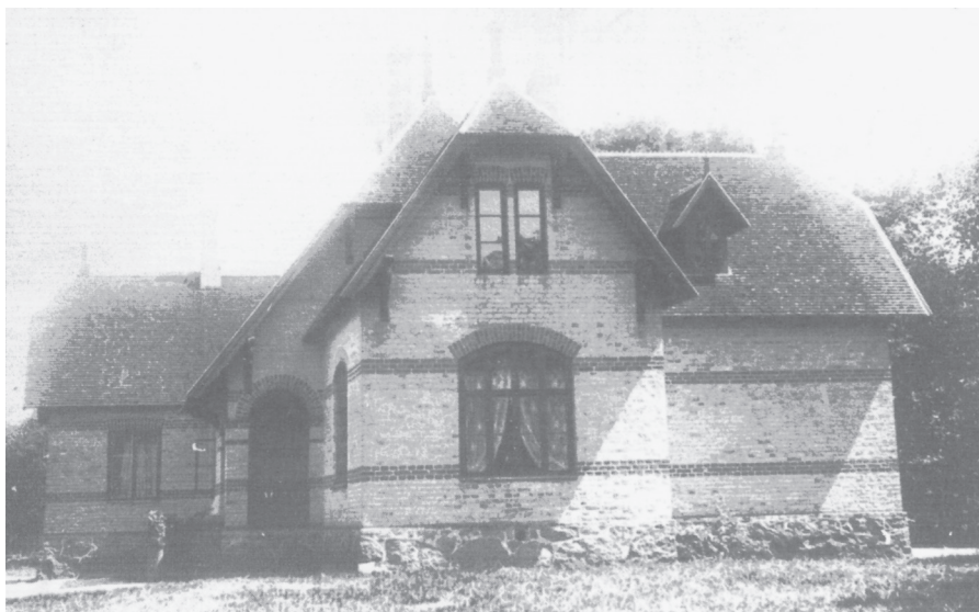
Egeside gård blev byggd 1871 och brann ner 1966

världskriget. Då var han också så nära Egeside att han ofta kunde se till gården och sina tre drängar där.