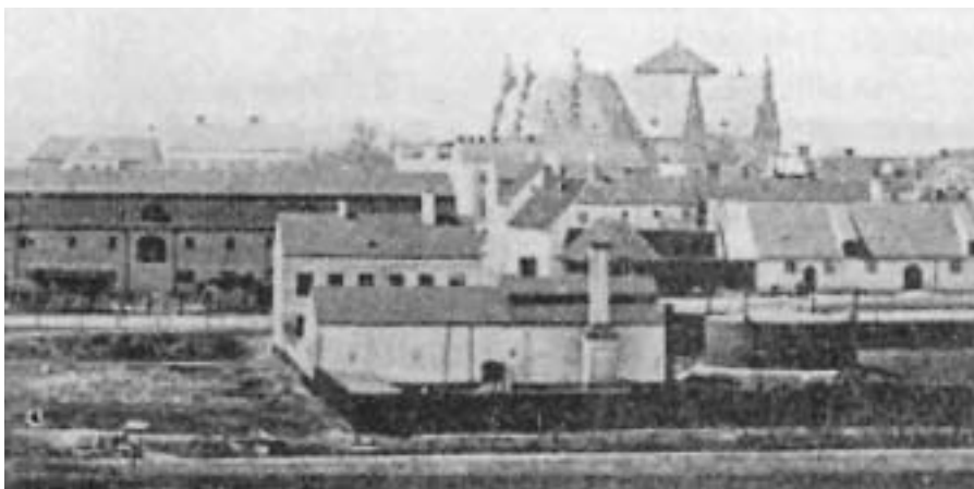
Gasverket vid Sommarro. Tyghuset (nuvarande Regionmuseet) till vänster, kyrktornet med pyramidtak bakom gasklockan.

Staden anvisade en tomt för gasverket i det så kallade Norra Tivoli. Det är det område som ligger norr om tvärkanalen (Nya Boulevarden) och mellan Östra Boulevarden och Råbelöfskanalen. Platsen förknippar äldre Kristian-