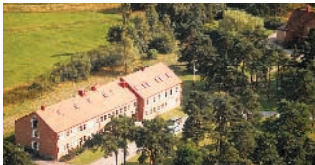
Kanslihuset i N. Åsum blev färdigt 1953 och först då kunde regementsstaben lämna Stora Kronohuset. (LM)

Nya vapenmodeller anskaffades i rask takt. Infanteriet fick automatgevär och kulsprutepistoler och nya kul-