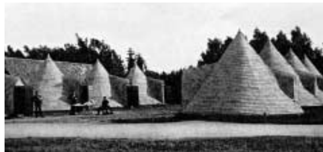
Spånklädda lägerhyddor på Norringarnas gamla mötesplats i Ljungbyhed.

Enligt 1901 års härordning skulle övningstiden för samtliga truppslag bli så lång, att kaserner erfordrades. Tiden på de gamla övningsshedarna var förbi och många städer tävlade om att via olika kommunala bidrag såsom gratis mark få sitt förband och därmed ökat skatteunderlag. Norra skånska infanteriregementet (I 24) hade satts upp i Kristianstad 1812 under ledning av sin förste chef, hjälten från finska kriget 1788-90 och 1808-09 generallöjtnant Georg Carl von Döbeln, men hade från 1821 sin fasta övningsplats på Ljungbyhed.