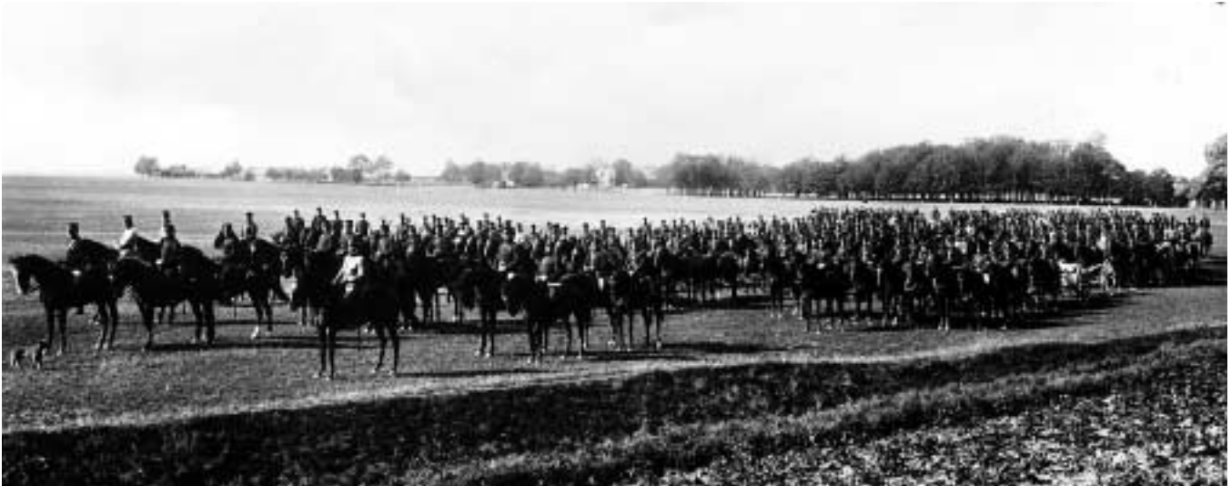
Wendes ridande division. (LM)

Han lyckades lotsa 1914 års härordning med 340 dagars övningstid för infanteriet och 365 för artilleriet genom riksdagen. Det hade han inte klarat om inte första världskriget brutit ut under pågående riksdagsbehandling i augusti 1914.