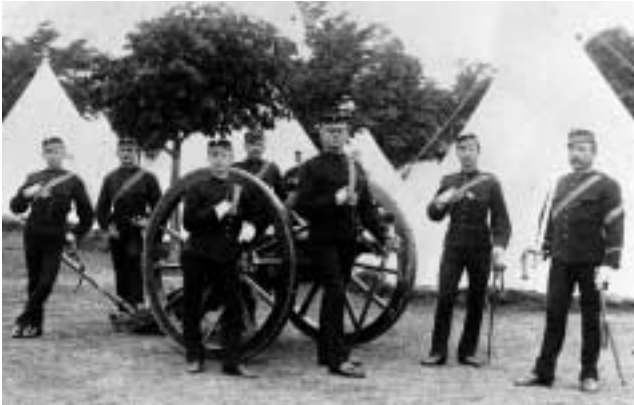
Den första räfflade kanonen var fortfarande framladdad. 8 cm kanon m/1863 på beväringsslägret på Näsby fält 1886.

östra, Fortifikationshuset på Västra Storgatan med lokaler för regementets skolverksamhet (Informationen) och matinrättning, ridhus och stall vid nuvarande Ridhusgatan med mera.