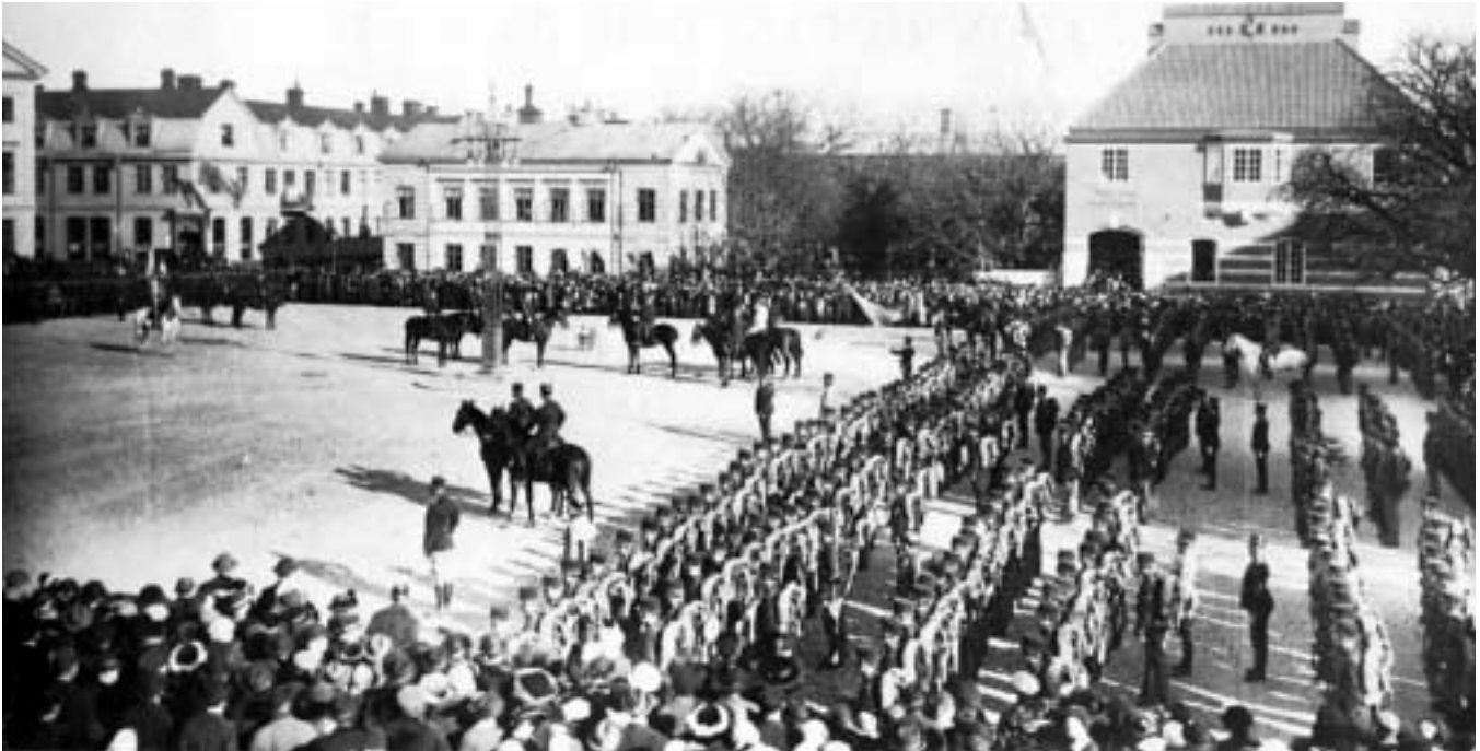
Norra skånska infanteriregementet gör sitt intåg i Kristianstad den 27 oktober 1915 och tas emot av Wendes artilleriregemente.

Trots dessa skrivelser beslöt stadsfullmäktige den 8 november 1906 att i allt väsentligt acceptera kommissionens villkor och gratis ställa mark till förfogande vid Lyckans höjd öster om Wendes nybyggda Östra kasern.