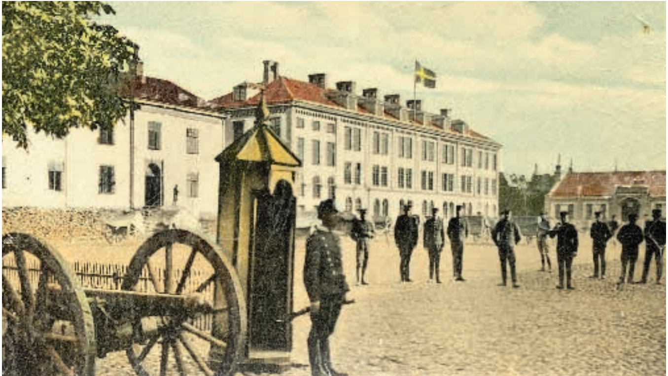
Wendes Södra kasern med byggnaden från 1793 till vänster och nybygget från 1897 till höger. (LM)

berget och Kiruna. Förryskningspolitiken i Finland var oroväckande och gjorde, att man tog detta steg från centralförsvaret. Enligt denna skulle fienden slås inne i landet, inte minst i anslutning till den stora förrådsfästningen i Karlsborg vid Vättern, men anläggandet av Bodens fästning var ett utslag av periferiförsvaret.