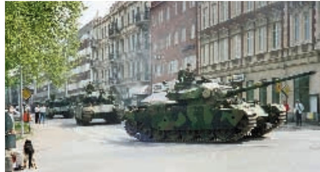
Norringtonarnas avskedsparad genom Kristianstad den 14 maj 1993. De kamouflagemålade 104-stridsvagnarna rullar för sista gången på stadens gator. (Christer Nyhlén)

Försvaret skulle alltså än en gång satsa mera på kvalitet än kvantitet. 1949 hade vi haft 37 brigader, 1987 29 och inför FB 92 diskuterades mellan 16 och 18. Det blev 16 och därmed var PB 26:s öde avgjort.