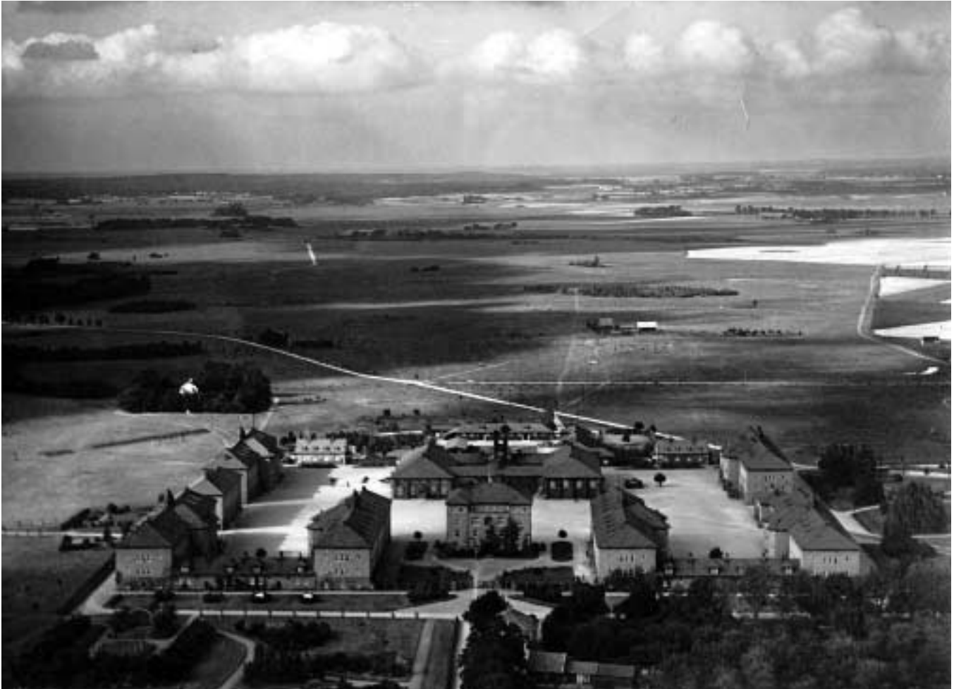
Norringarnas kasernetablisement å Näsby omkring 1930. (Ljungbyheds Militärhistoriska Museum)

Någon förnyelse av pjäsmaterielen skedde inte, bortsett från en modernisering av 7,5 cm kanon m/02. I övrigt skulle nya modeller inte komma förrän världskriget brutit ut. Viss förbättring av skottvidderna skedde genom att nya ammunitionstyper togs i bruk.