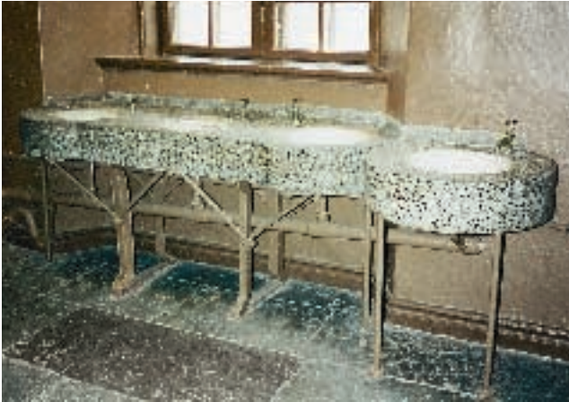
Genom att installera tvättställ i trappuppgångarna försökte man modernisera Norra kasern. (LM)

detta sammanslaget med ”gamla Milo Väst” med Kristianstad som stabsort.