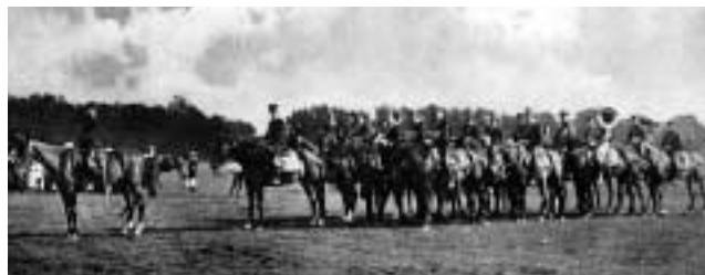
Wendes beridna musikkår. (LM)

De bägge skånska infanteriregementena fick se sitt kompaniantal halverat. För Wendes del blev det sex batterier istället för tretton. Ett av dem utrustades med 15 cm haubits m/06, som tidigare funnits på det indragna Positionsartilleriregementet i Stockholm. 20 officerare och 16 underofficerare och ett stort antal furirer, korpraler och stamanställda meniga fick sluta på I 24 – eller I 6 som det nu hette, sedan denna beteckning blivit ledig efter indragna Västgöta regemente i Vänersborg. På A 3 minskade officerarnas numerär från 63 till 41, underofficerarnas från 43 till 26 och det värvade manskapets från 381 till 182. Den särskilda garnisonsförsamlingen för yrkesmilitärerna och deras familjer avskaffades också. Den nya organisationen skulle vara genomförd 1928 och de dödsdömda förbanden, däribland Wendes ridande division, avtackades efter repetitionsövningarna hösten 1927.