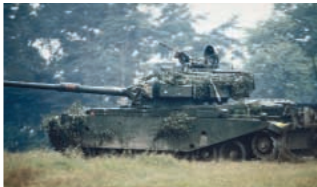
1984 erhöll Norringarna nya stridsvagnar i form av Stridsvagn 104. På bilden en stridsvagn 104 (ombyggd stridsvagn 102). (Christer Nyhlén)

Det alliansfria Sveriges försvarspolitik var som tidigare sagts dyrbar. 1958 års försvarsbeslut (FB 58) avsågs innebära en kvantitativ bantning till förmån för kvaliteten, inklusive ett årligt rampåslag om 2,5 procent för teknisk fördyring. Tio år senare ströks denna procentuppräknings i ett nytt försvarsbeslut (FB 68). Försvarskostymen var dock fortfarande för stor och alltmera omodern.