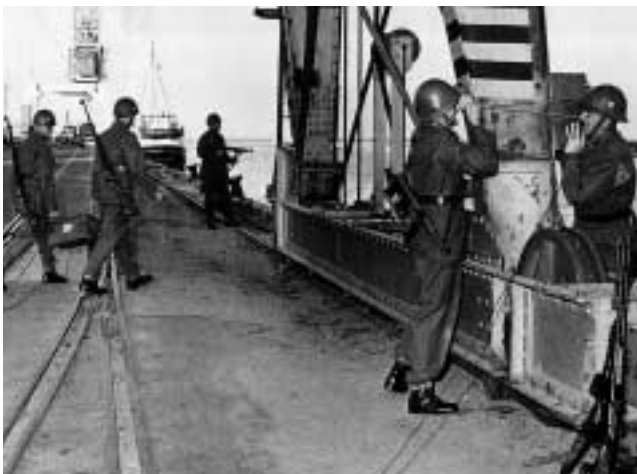
Hemvärnsövning i Åhus hamn. (Ur Bandholtz-Löfgren: Hemvärnet)

Dagens motsvarighet till skarpskytterörelsen är Hemvärnet. Det uppstod spontant under andra världskrigets första år trots motstånd från myndigheter och Landstormsföreningarnas Centralförbund (föregångare till dagens Frivilliga Befälsutbildning, FBU). Efter det tyska överfallet på Danmark och Norge den 9 april 1940 fick hemvärnet emellertid klartecken och statsmakternas välsignelse.