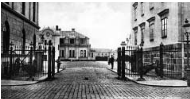
Vakten vid Södra kasern omkring 1915. (LM)

tegel i hörnet nuvarande Norra Kaserngatan-Norretullsvägen tillkommit och 1904-06 byggdes Östra kasern.