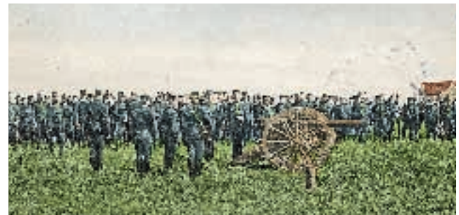
8,4 cm kanon m/1881 – vår första bakladdade kanon – avlossar de första skotten på Rinkaby skjutfält den 26 juni 1900. (LM)

Några år senare fick fältartilleriet en ny pjäs, 8,4 cm kanon m/1881 av Krupps modell och en skottvidd upp