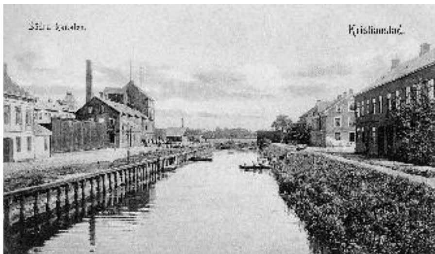
Södra kanalens östra del från sydväst. T.v. närmast bostadshus och plank i nuv. kvarteret Pontonen, därefter Neumanns spritfabrik. T.h. närmast bostadshus i nuv. kvarteret Tuppen, därefter bostadshus i nuv. kvarteret Storken. Foto tidigast omkring 1905. Vykort.