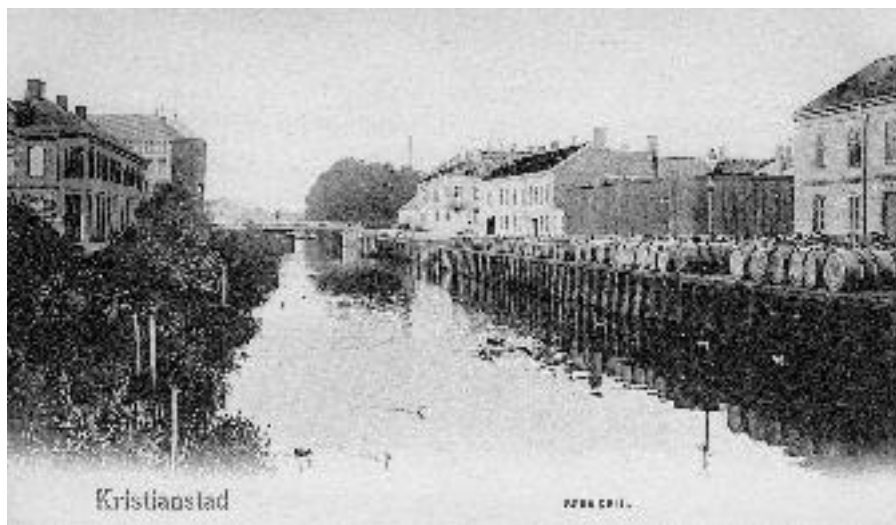
Södra kanalens västra del från nordost. T.v. närmast bostadshus i nuv. kvarteret Tuppen, därefter Wahlbergs kvarn. T.h. närmast Neumanns spritfabrik, därefter plank och bostadshus i nuv. kvarteret Pontonen, därefter byggnader tillhörande Ljunggrens verkstad. Foto tydligen någon gång ca 1890 – ca 1905. Vykort.