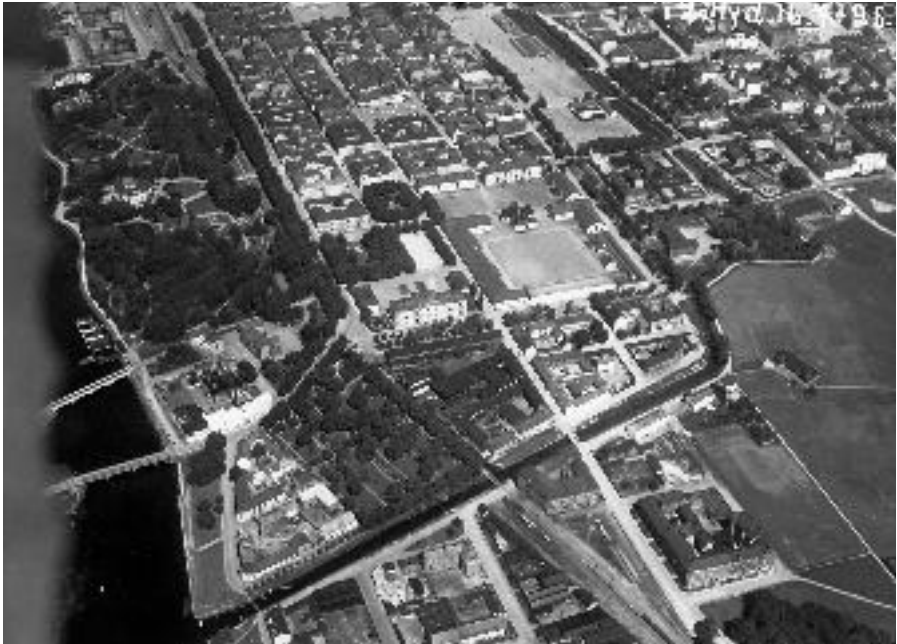
Flygfoto över södra och mellersta delarna av centrala Kristianstad från söder, med Södra kanalen i bildens nedre del. Foto 1925. (Regionmuseet Kristianstad)

andra hälften av 1880-talet. Vid den sistnämnda delen och längs kanalen väster därom byggdes kaj.